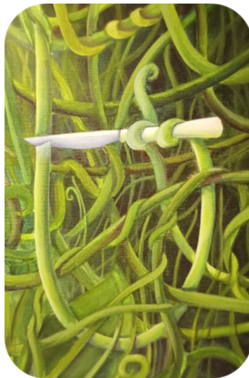
Image n°3 tirée du jeu Dixit © choisie par Haviva (6,5 ans) pour décrire ses loisirs dans l'hébergement citoyen

« Un grand jardin. Et des jeux pour s'accrocher ! Une balançoire. Ah oui, et il y avait des ruches ! Des abeilles. »