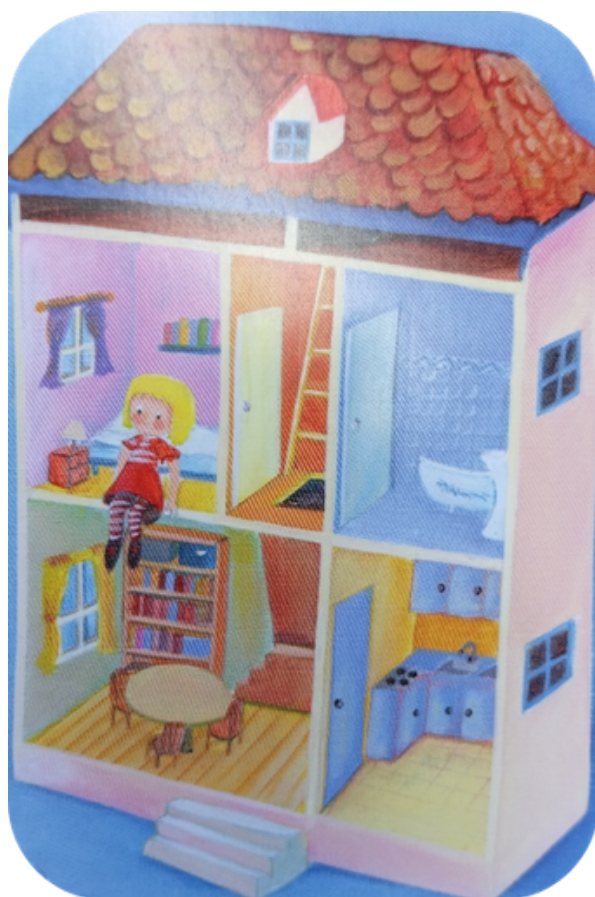
Image n°2 tirée du jeu Dixit © choisie par Nabil (8 ans) pour décrire le lieu d'hébergement